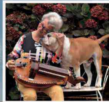
Une Nationale contre vents et marées