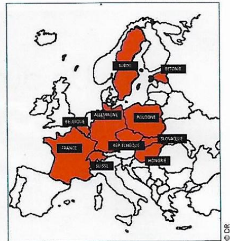
Carte des pays reconnaissant la race du bulldog continental.

Un jour, quand j'étais jeune, je suis tombé en sidération devant un dogue de Bordeaux,